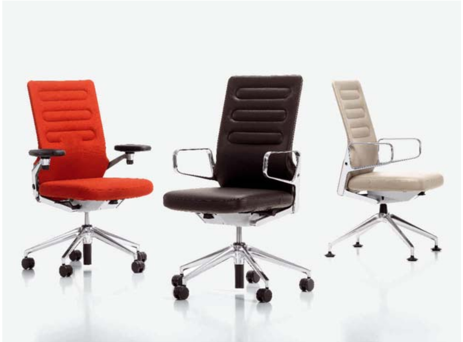
AC 4 gibt es für unterschiedliche Zwecke in verschiedenen Varianten – mit dem Viersternfuss eignet er sich ideal im Konferenzbereich.

Antonio Citterio, Architekt und Designer, lebt und arbeitet in Mailand. Er entwirft Produkte für namhafte Unternehmen wie B&B Italia, Flexform oder Ansgo. Mit Vitra arbeitet er seit 1988 zusammen. In dieser Zeit sind eine Reihe von Bürostühlen und Bürosystemen entstanden. Die Citterio Kollektion wird laufend erweitert.