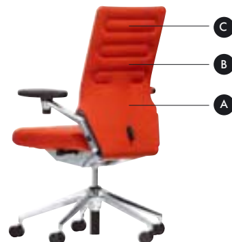
Die innovative Technik für gesunden Komfort ist in der eleganten Rückenlehne verborgen.