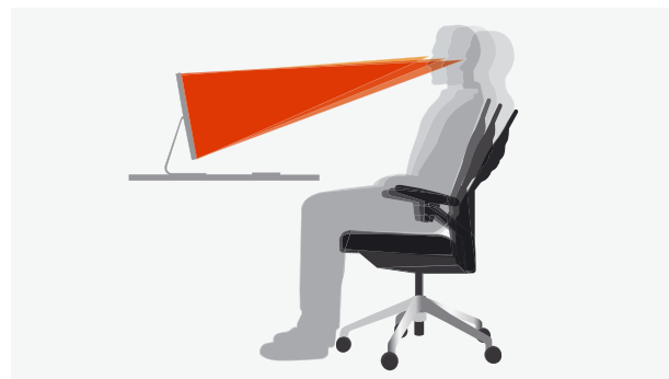
La innovadora tecnología destinada a un confort saludable permanece oculta en el elegante respaldo.