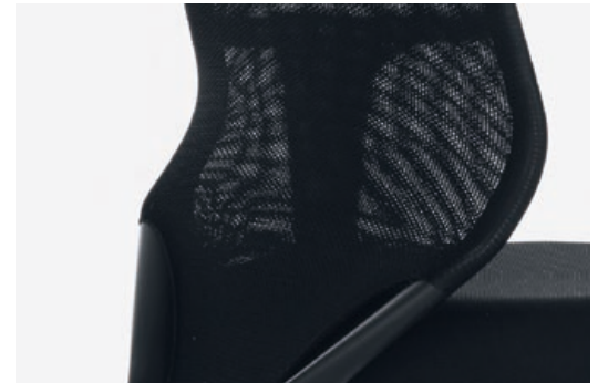
Der flexible Rückenrahmen bietet Bewegungsfreiheit.