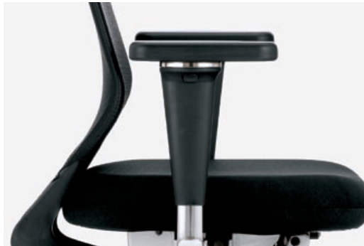
Die 3-D-Armlehnen sind auf jedes Bedürfnis einstellbar.