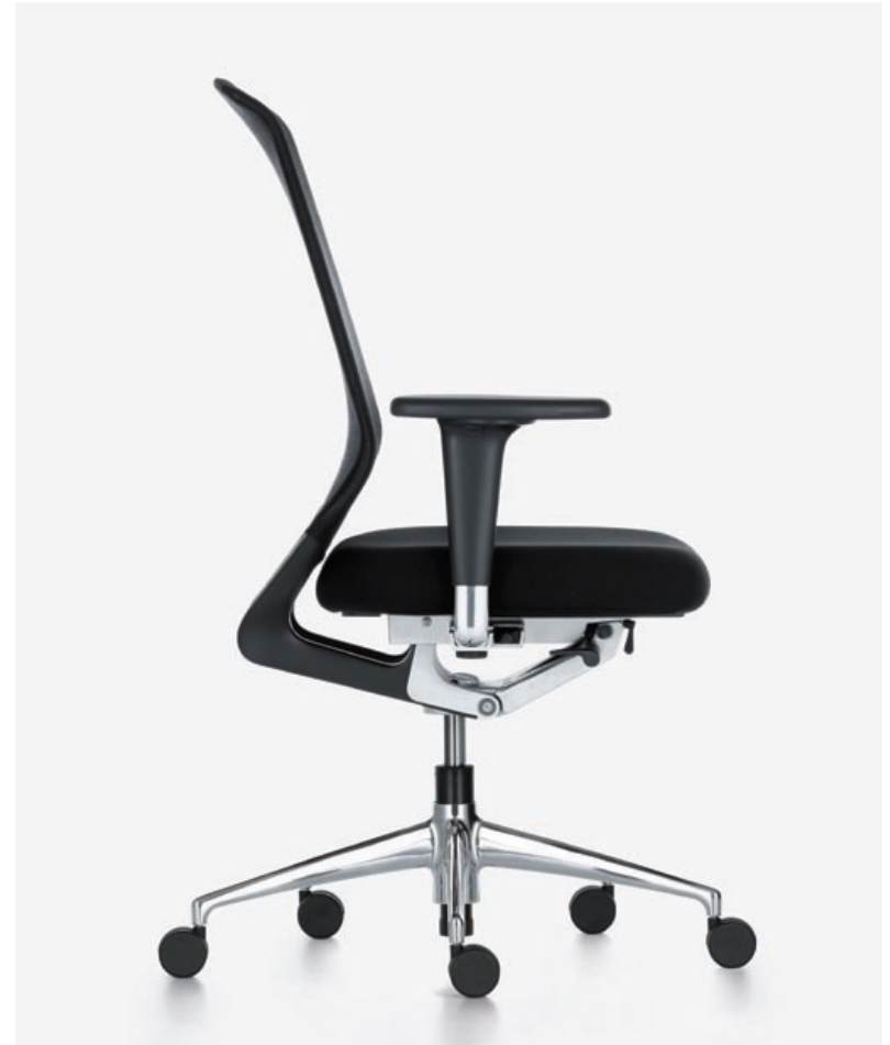
Aufgrund seiner zurückhaltenden Anmutung passt MedaPro in jede Büroumgebung.