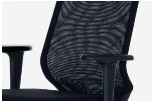
Der Netzbezug sorgt für ein angenehmes Sitzklima.

Der aus einem Guss gefertigte, innovative Rückenrahmen aus Polyamid mit dem frei verspannten, gestrickten Netzbezug bietet Stützung im Lumbalbereich und gleichzeitig Flexibilität und Bewegungsfreiheit für den oberen Rücken und die Schultern. Zusammen mit dem grossen Öffnungswinkel für ein entlastendes Zurücklehnen und der Mechanik für einen harmonischen Bewegungsablauf sorgt die Konstruktion für hohen Komfort.