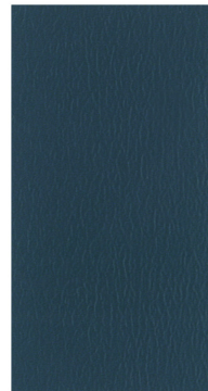
PA11 Colonial Blue