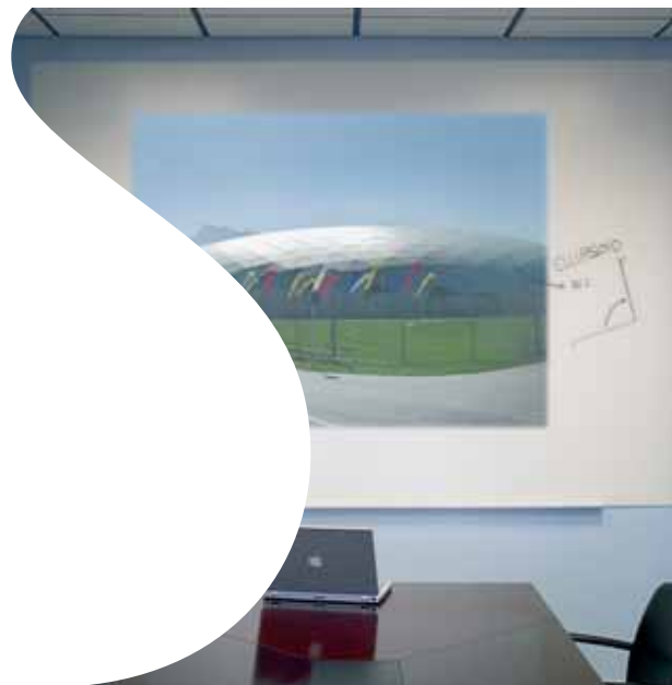
→ LuxFine® Board

National and international leader in obtaining the quality certificate ISO 9001 and ISO 14001 in environmental quality. Its strict routine controls give SEVASA the seal of an eco friendly and sustainable company.