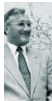
Design Edlef Bandixen 1963.

• Genuinely simple. Designed in 1963 by Edlef Bandixen, it embodies the simple chair design. Both then and now. The seat in moulded plywood is suspended as by artifice, the stabilizing back invisibly fixed to the steel tube. With this reedition, Bandixen opens a new chapter in chair design. Visible and stackable. Any time, anywhere.