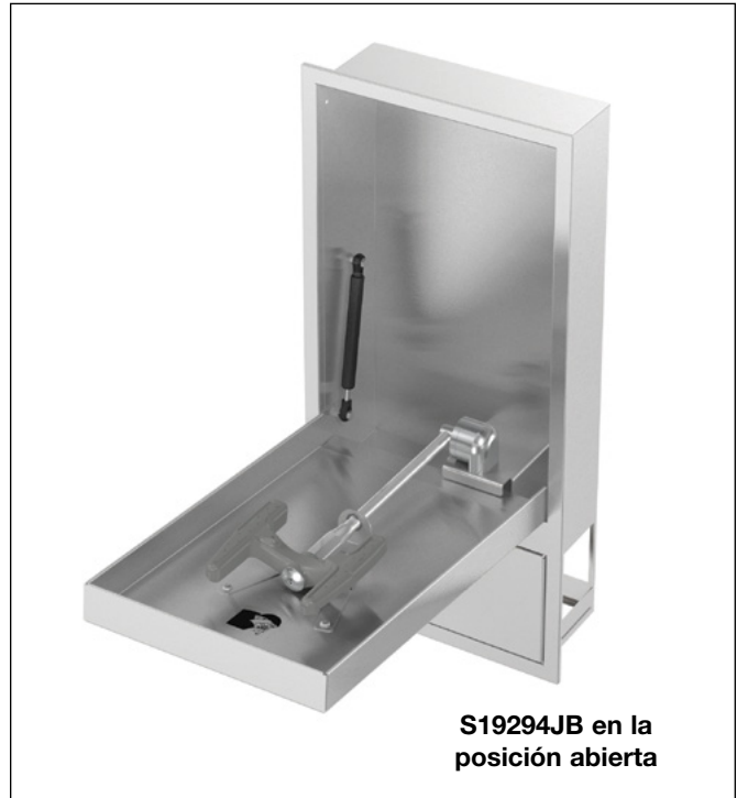
S19294JB en la posición abierta

Se proporciona desagüe de 1¼" con el tubo de aspiración. Opción de desechos del sifón en P disponible también (S19294JBT).